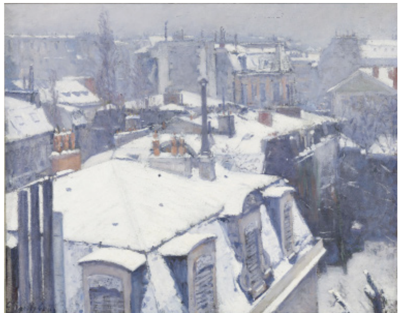
منظر للأسطح (تأثير الثلج)، قال أسطح الجليد - كايوت غوستاف (1848-1894)

كما أن بياض الثلج يُتيح للفنانين، الذين استندوا إلى نظريات علمية معينة، دعامةً مثاليةً في تجاربهم على الظلال المُلونة والألوان المُكملة. وبالفعل ومنذ نهاية القرن الثامن عشر، أبرز مُنظرو اللون أن تلوين الظلال وعلاقات التقابل بين ما يسمى الألوان الأولية والثانوية: الأصفر يقابل الأرجواني، والأحمر الأخضر والأزرق يُقابله البرتقالي، كما أن التعارضات تبقى منسجمةً حينما يتبادل اللونان المرتبطان ببعضهما البعض الإشعاع. وهكذا، في المناظر الطبيعية لمونيه أو سيسلي، عندما تشع الشمس ضوءاً أصفرًا - برتقالياً، تميل ظلالها لتكون زرقاءً.