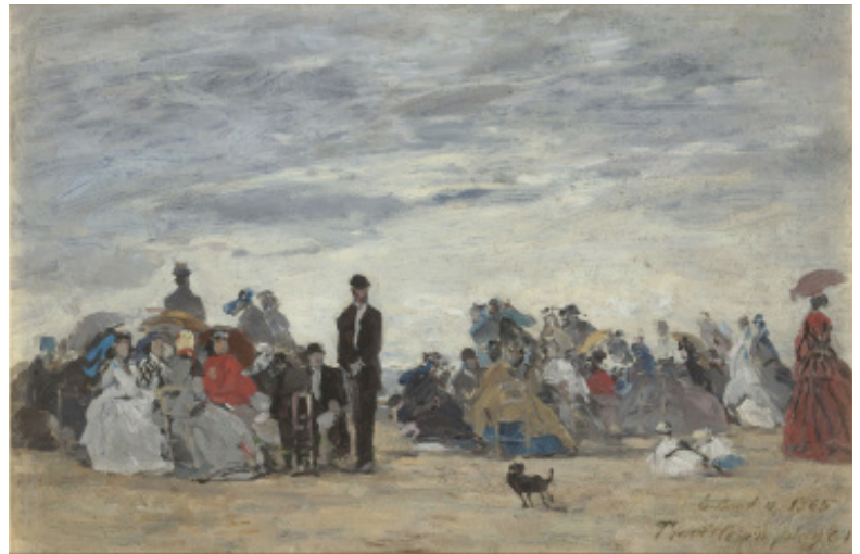
La plage de Trouville - Boudin Louis-Eugène (1824-1898)

Le goût pour la lumière amène les impressionnistes à choisir pour sujets des motifs nouveaux. Les sous-bois ombragés sont remplacés par des jardins largement ensoleillés, par des paysages fluviaux ou de bord de mer, ou encore par des vues urbaines modernes. Le plein soleil, qui permet de réduire les zones d'ombre, est particulièrement recherché, tout comme les ciels voilés qui baignent la nature d'une lumière douce et égale.