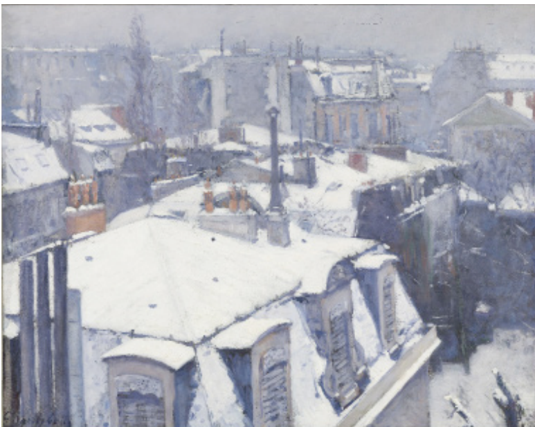
Vue de toits (Effet de neige), dit Toits sous la neige - Caillebotte Gustave (1848-1894)

La représentation de la neige est particulièrement prisée des impressionnistes dans les années 1860 et 1870. Traduire les nuances d'un paysage recouvert d'un uniforme manteau blanc, c'est relever le défi de traduire les infinies nuances de la lumière sur une matière monochrome dont la pâte du peintre devra rendre la légèreté.