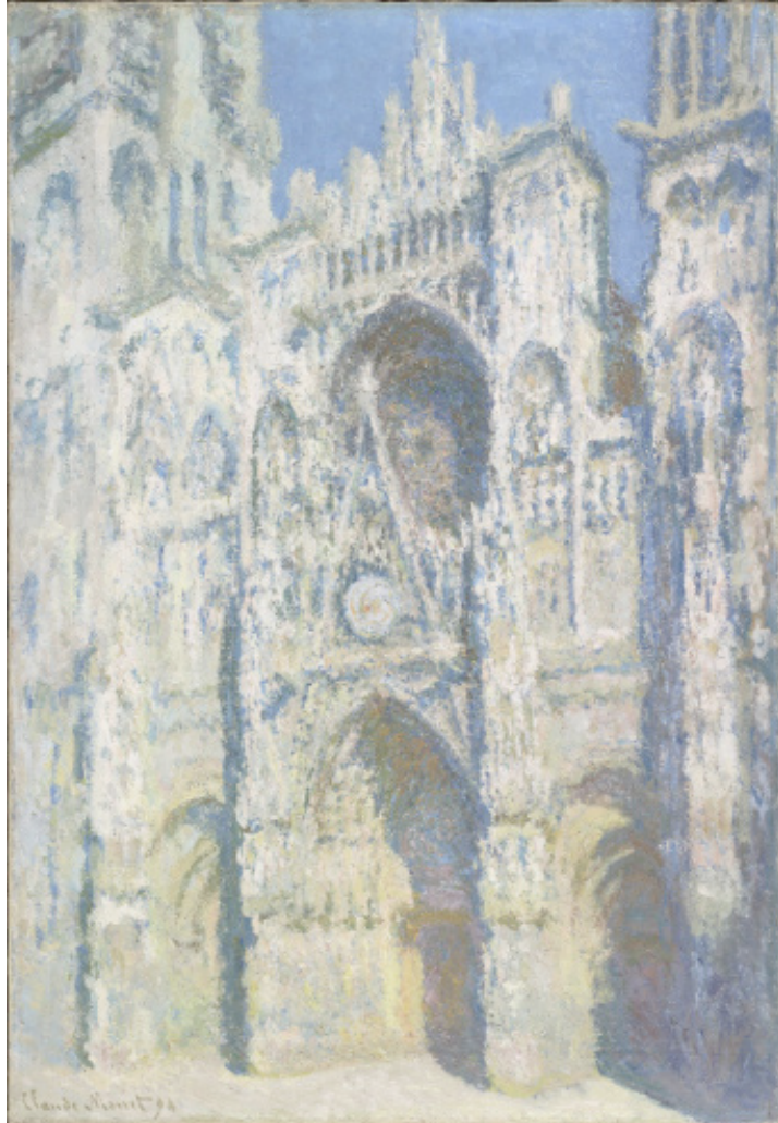
كاتدرائية رومان ، البوابة وبرج القديس رومان ، الشمس الكاملة ، الانسجام الأزرق والذهبي مونييه كلود (قال) ، مونييه كلود أوسكار (1840-1926) القصر الكبير

في السنوات الأخيرة من القرن التاسع عشر وبداية العشرين، وفي مرحلة شديدة الفورة النظرية والفنية، ظهرت حركات جديدة (النبي، الرمزية، التوحشية) لعبت اللون دورًا رئيسًا لديها إذ كان كاشف الأحاسيس. بهذا المعنى تناولت الأعمال الانطباعية اللون من زاوية مُتجددة جزئيًا. ففي لوحات مونييه المتأخرة، لم يعد الفنان يتلهى بالتقابلات الصريحة بين الألوان، ولكنه يُراهن على الترابط المنسجم وعلى استخدام تشكيلة جديدة من أطراف اللون، وبخاصة الوردية بين رينوار فقد غير هو أيضاً ملونهُ ومكان رؤيته فجعلها مُنعطفةً إلى اساتذته من رسامي اللوفر؛ فاشتغل على ترجمة تآلق وشفافية الأجساد الأنثوية بألوان وردية زاهية وحمراء صُراح. سيزان بدوره، وأمام المناظر الطبيعية لمسقط رأسه بروفانس، طورَ نظامًا للتلوين يجعل الرسم «انسجامًا متوازيًا مع الطبيعة». هناك في منطقة بروفانس نفسها، في آرل، كان فانسن فان غوخ أطلق وبشكل نهائي القوة التعبيرية والرمزية للألوان بما فتح الباب على مصراعيه أمام كبرى تجارب التشكيل في القرن العشرين.