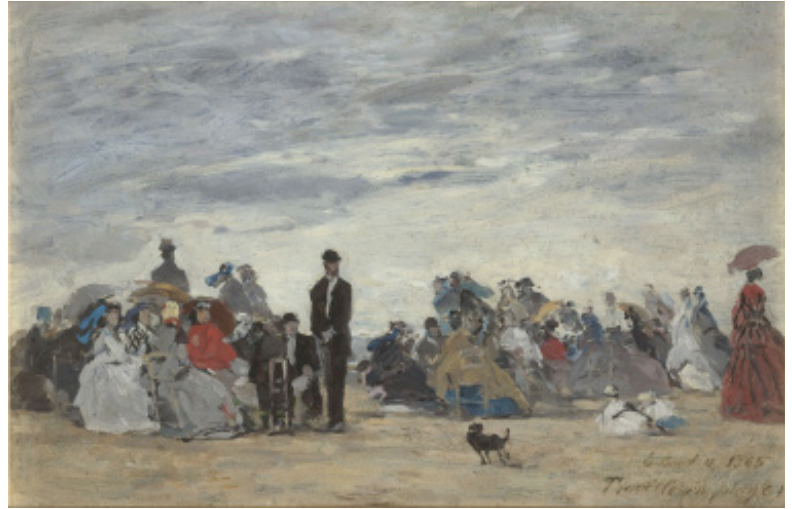
The beach of Trouville - Boudin Louis-Eugène (1824-1898)

These artists, tired of seeing their paintings rejected by the jury of the Official Salon, organized their first group exhibition in 1874. On this occasion, an art critic mocked them with the name of «impressionists».