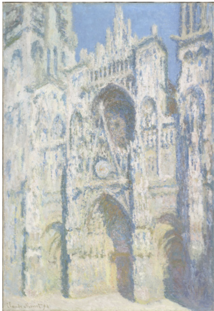
Rouen Cathedral, the gate and the Saint Romain tower, full sun, blue and gold harmony Monet Claude (said), Monet Claude-Oscar (1840-1926)

In the last years of the century and at the beginning of the 20th century, at a time of great theoretical and artistic effervescence, new movements emerged (Nabi's, symbolism, fauvism) for which color held a major place. It now expresses the artist's emotions. In this context, the impressionist works approach color from a partly renewed angle. In Monet's late paintings, the artist no longer plays on vivid contrasts but on the softness of harmonious associations and the use of a range of new tones, notably roses. Renoir also transformed his palette, his gaze, turned towards the painters of the Louvre his elders; he worked to translate the radiance and transparency of female flesh with luminous tones of roses and clear reds. Cézanne, for his part, facing the landscapes of his native Provence, developed a colorful system that made painting a «harmony parallel to nature». It is also in Provence, in Arles, that Vincent Van Gogh definitively liberates the expressive and symbolic power of colors, opening the way to the great experiments of the 20th century.