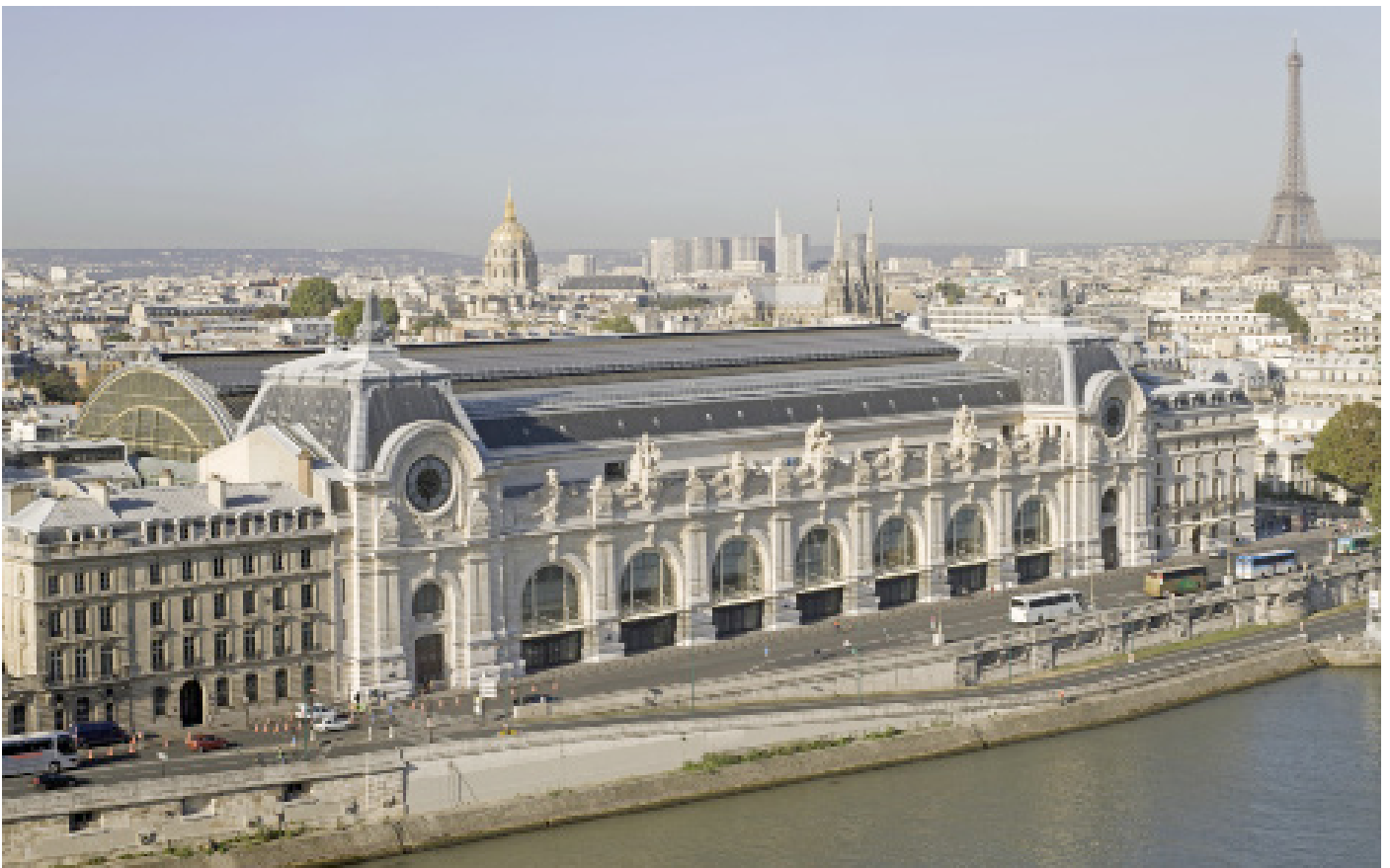
Aerial view of the Musée d'Orsay - Patrice Schmidt