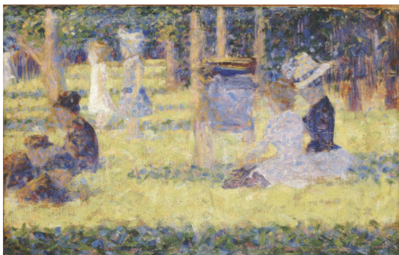
Seated women and children's car - Study for «a Sunday afternoon at Grande Jatte Island» Seurat Georges (1859-1891)

The new generation of neo-impressionists, Georges Seurat and Paul Signac, emerged publicly during the Impressionist group's last exhibition in 1886. Wishing to push further and rationalize the colorful experiments of their elders, from Eugène Delacroix to Monet, the neo-impressionists imagined a technique inspired by the scientific theories of Michel Eugène Chevreul or Ogden Rood. To this principle, neo-impressionists associate the principle of optical mixing. A purple will no longer be obtained by mixing red and blue pigments, but by the juxtaposition of red and blue touches, which in the viewer's eye, form the purple. Before the Impressionists, Delacroix had given first place to color in his paintings and had shown great audacity in the use of bold tones. Paul Signac, theorist of the neo-impressionist group, made him the first milestone of this modern color revolution in his founding text, «From Eugene Delacroix to Neo-impressionism», published in 1898 in La Revue Blanche .