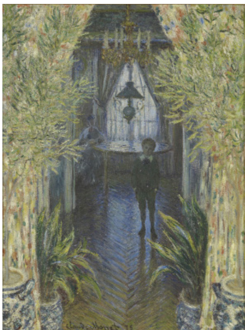
A corner of an apartment Monet Claude (said), Monet Claude-Oscar (1840-1926)

The landscape genre was widely practiced by all impressionists. Monet, Renoir and Sisley set out to paint the banks of the Seine to the west of Paris, from Argenteuil to Bougival, where Parisians canoe. Pissarro and Cézanne, in the North-West, plant their easel around Pontoise and depict a rural countryside and its farmers. If their dominant colors remain green and blue, as they were for previous generations, they are thus nuanced by a multitude of other shades. Impressionists also challenge themselves by choosing complex subjects: changing skies and shifting waters.