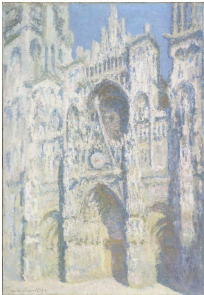
Cathédrale de Rouen, le portail et la tour Saint Romain, plein soleil, harmonie bleue et or Monet Claude (dit), Monet Claude-Oscar (1840-1926)

Dans les dernières années du siècle et au début du XXe siècle, à une période de grande effervescence théorique et artistique, émergent de nouveaux mouvements (nabis, symbolisme, fauvisme) pour lesquels la couleur tient une place majeure. Elle exprime désormais les émotions de l'artiste. Dans ce contexte, les œuvres impressionnistes abordent la couleur sous un angle en partie renouvelé. Dans les toiles tardives de Monet, l'artiste ne joue plus sur les vifs contrastes mais sur la douceur d'associations harmonieuses et l'usage d'une gamme de tons nouveaux, notamment des roses. Renoir transforme aussi sa palette, le regard, tourné vers les peintres du Louvre ses aînés ; il s'emploie à traduire l'éclat et la transparence des chairs féminines avec de lumineux tons de roses et des rouges francs. Cézanne, de son côté, face aux paysages de sa Provence natale, élabore un système coloré qui fait de la peinture une « harmonie parallèle à la nature ». C'est en Provence également, à Arles, que Vincent Van Gogh libère définitivement la puissance expressive et symbolique des couleurs, ouvrant le chemin aux grandes expérimentations du XXe siècle.