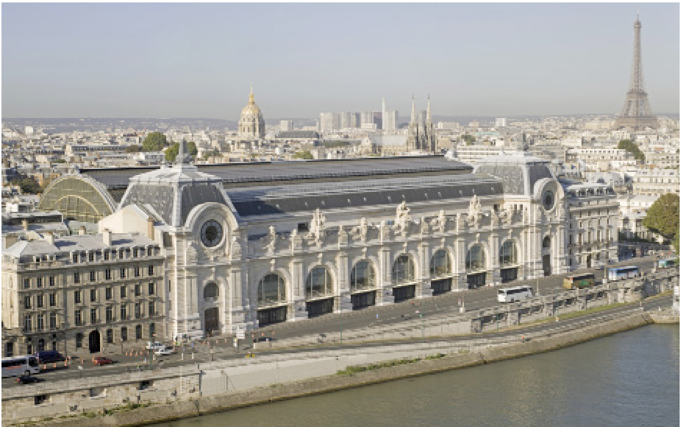
Vue aérienne du musée d'Orsay - Patrice Schmidt