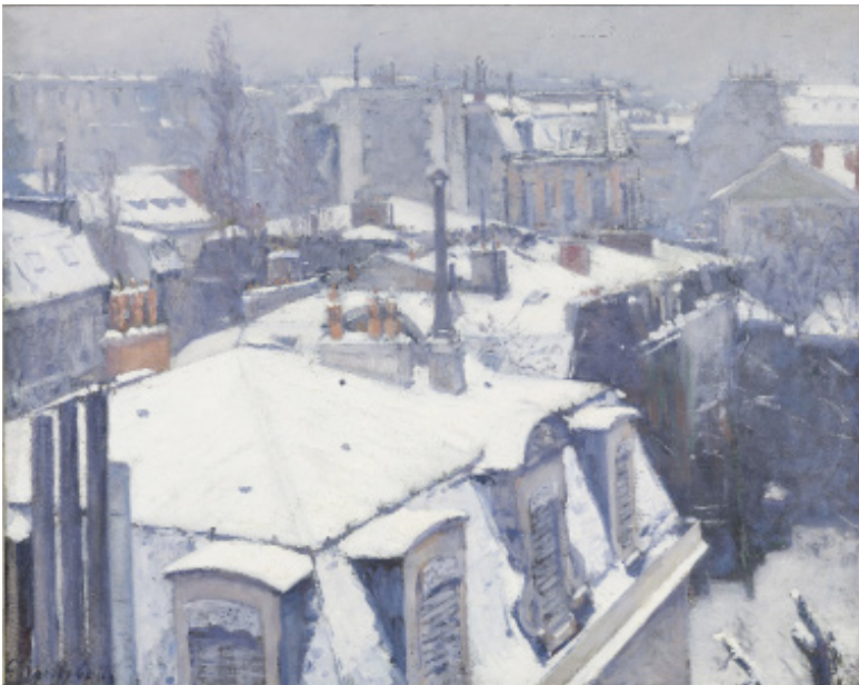
View of roofs (Snow effect), known as Roofs under the snow - Caillebotte Gustave (1848-1894)

The representation of snow was particularly popular with the Impressionists in the 1860s and 1870s. Translating the nuances of a landscape covered with a uniform white coat is a challenge to translate the infinite nuances of light into a monochrome material whose lightness should be rendered by the painter's paste.