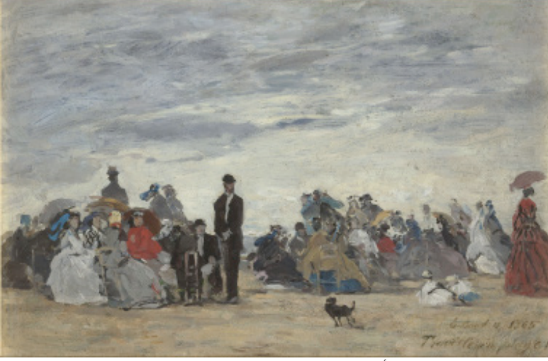
شاطن تروفيل بودين لويس أوجين (1824-1898)

حاول جيلٌ جديدٌ من الفنانين؛ الذين ظهروا على مسرح التشكيلي الباريسي لأول مرة في ستينيات القرن التاسع عشر، التخلّص من الموضوعات ومن العمل في الورشة مُفضّلين ممارسة فنّ المنظر الطبيعي باللّجوء عمداً إلى مَلَوْنٍ أكثر إشراقاً، ورسم اللوحة انطلاقاً من موضوع لها.