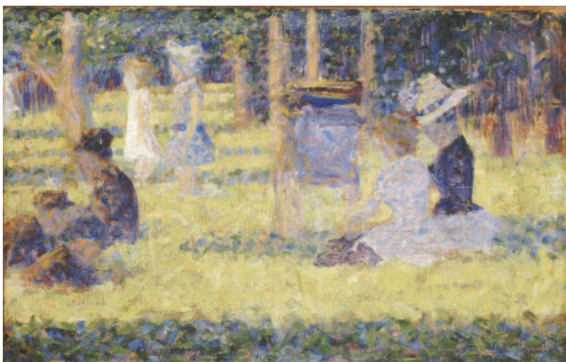
Femmes assises et voiture d'enfant - Etude pour «un dimanche après-midi à l'île de la Grande Jatte» Seurat Georges (1859-1891)

La nouvelle génération des néo-impressionnistes, celle de Georges Seurat et Paul Signac, émerge publiquement lors de la dernière exposition du groupe impressionniste, en 1886. Souhaitant pousser plus loin et rationaliser les expérimentations colorées de leurs aînés, d'Eugène Delacroix à Monet, les néo-impressionnistes imaginent une technique inspirée par les théories scientifiques de Michel Eugène Chevreul ou Ogden Rood. A ce principe, les néo-impressionnistes associent celui du mélange optique. Un violet ne sera plus obtenu par mélange de pigments rouges et bleus, mais par la juxtaposition de touches rouges et bleus, qui dans l'œil du spectateur, forment le violet. Avant les impressionnistes, Delacroix avait donné la première place à la couleur dans ses tableaux et avait fait preuve d'une grande