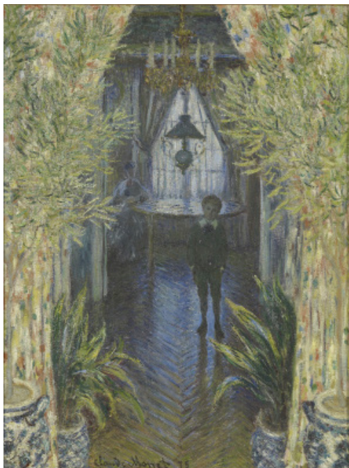
Un coin d'appartement Monet Claude (dit), Monet Claude-Oscar (1840-1926)

Le genre du paysage fut largement pratiqué par tous les impressionnistes. Monet, Renoir et Sisley s'attachent à peindre les bords de la Seine à l'Ouest de Paris, d'Argenteuil à Bougival, où les parisiens font du canotage. Pissarro et Cézanne, au Nord-Ouest, plantent leur chevalet autour de Pontoise et dépeignent une campagne rurale et ses paysans. Si leurs couleurs dominantes restent le vert et le bleu, comme elles l'étaient déjà pour les générations antérieures, elles se nuancent ainsi d'une multitude d'autres teintes. Les impressionnistes se mettent aussi au défi en choisissant des sujets complexes : les ciels changeants et les eaux mouvantes.