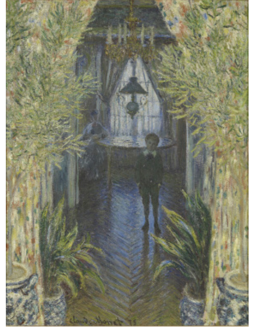
زاوية من شقة مونييه كلود (قال) ، مونييه كلود أوسكار (1840-1926)

كلُّ الفنانين الانطباعيين رسموا وعلى نطاق واسع المنظر الطبيعي. تصك بهذا النوع كل من مونييه ورونوار وسيسلّي عندما رسموا ضفافَ نهر السين من أرجونتوي إلى بوجيغال، حيث كانت تُجدف الزوارق الباريسية غربا. بيسارو وسيزان أيضا رسما المنظر الطبيعي للشمال الغربي، عندما كانا يضعان حامل لوحتيهما نواحي بونتواز ويرسمان الريف والفلاحين. لذلك إذا كانت ألوانهما الأخضر والأزرق ظلت مهيمنةً، كما كانت بالفعل عند الأجيال السابقة، فلأنها تتمايز عن ألوان أخرى عديدة. لقد واجه الانطباعيون أيضا تحدي اختيارهم لموضوعاتٍ صعبة: السماوات المتغيرة والمياه الجارية. في شغفهم بالألوان غير الممزوجة، والأكثر إشراقًا، أمكن للانطباعيين اللجوء إلى صبغات جديدة ظهرت وتطورت بفضل تقدم الكيمياء. فعلى سبيل المثال، استبدلت الخلطات التقليدية الباهتة للألوان الزرقاء والصفراء وطيف التراب وعوّضتها تدريجيا أصباغ اصطناعية خضراء لامعة (أخضر فيرونيز، أخضر زمردي).